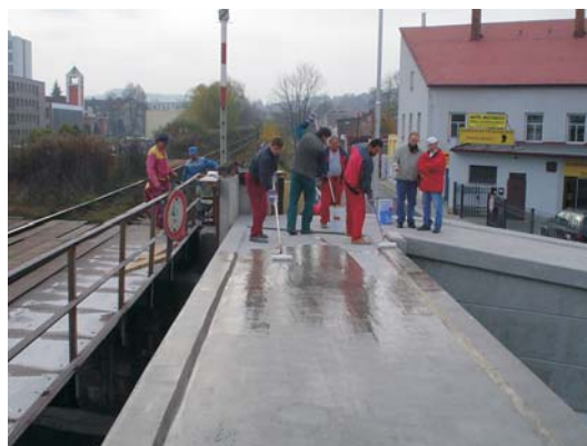
Penetrace podkladu PAB 1