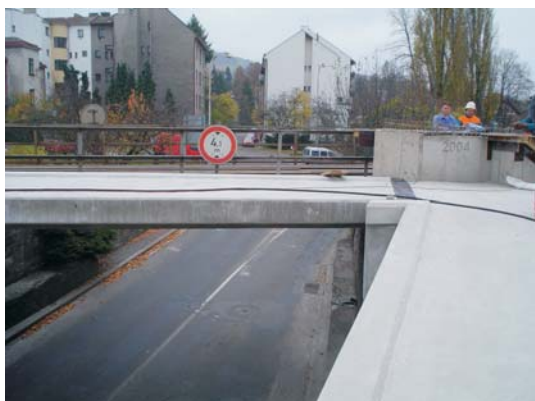
Stav při převzetí lávky

Penetrace PAB 1, Bridgemaster® 4mm, Agregát s frakcí 1 - 2,5mm černá barva, Acrylic Sealer