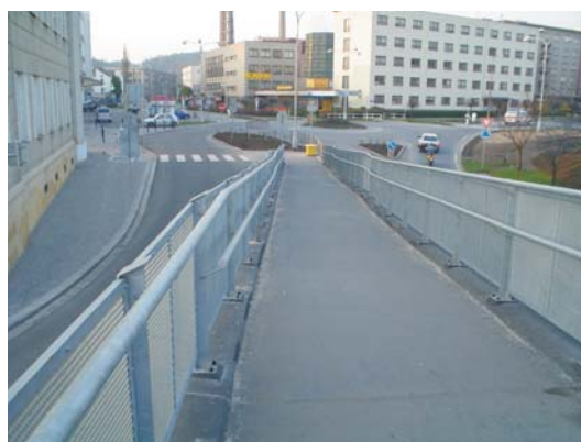
Celkový pohled na dokončenou lávku