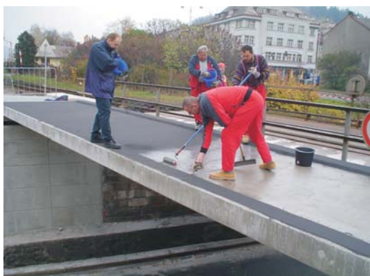
Aplikace BRIDGEMASTER® na plochu